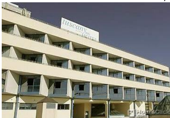
Hotel Tuscany Inn

Via Cividale 86, 51016 Montecatini Terme