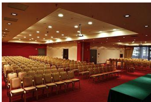
Sala di registrazione